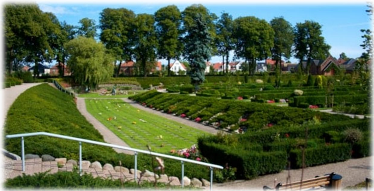
Del af Nyborg Kirkegård

Tilmelding: kasserer@nyborgmuseumsforening.dk .