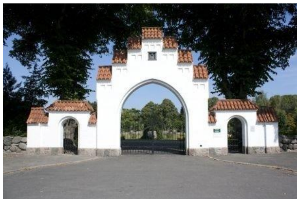
Udsnit af Nyborg Kirkegård

Tilmelding: kasserer@nyborgmuseumsforening.dk